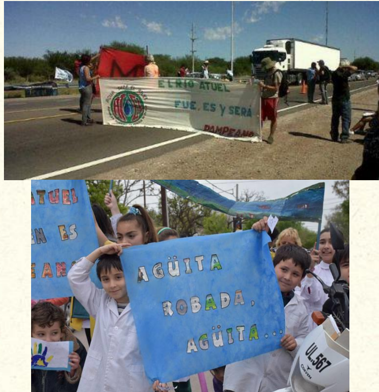
Figura 3: Diferentes movilizaciones pampeanas por el río Atuel-Chadileuvú.