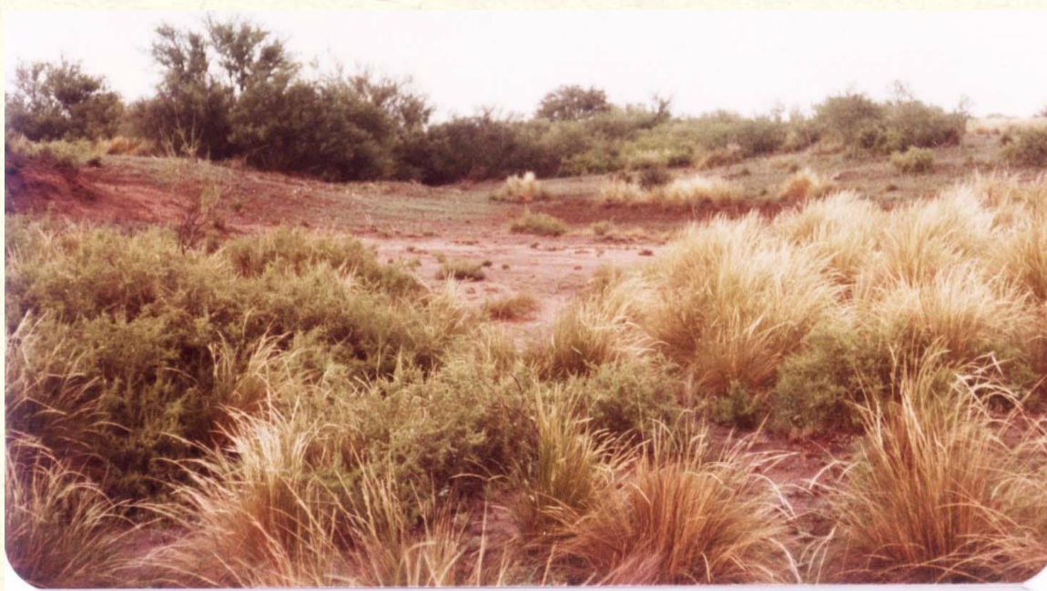
Figura 2: Arroyo Butaló seco (brazo del Atuel) en La Pampa.

En esta zona continuaban los Bañados del Atuel, presentes en Mendoza en un corredor fluvioalustre de unos 300 km de largo, compuesto por brazos mayores y menores de los ríos Atuel y Salado-Chadileuvú, que formaban esteros, lagunas, y bañados, con islas y albardones integrados en un sistema que originalmente conformó lo que se calificaba como “impenetrables bañados del Atuel y el Chadileuvú”. 20 Agrega Cazenave: “Con posterioridad a 1879, tras la ocupación militar del territorio ganado al indio, se volcó sobre la región una gran cantidad de pobladores, criollos e inmigrantes, ansiosos de conseguir tierras”. 21 En 1898, en la denominada Isla de Chalileo, aparece el topónimo “Chacras de Pío Laza”, localidad que por una parte era estación de la galera, que hacía el servicio con Santa Rosa, capital del entonces Territorio Nacional, y, sobre todo, la indicación de “chacra” refiere la idea de cultivos. 22