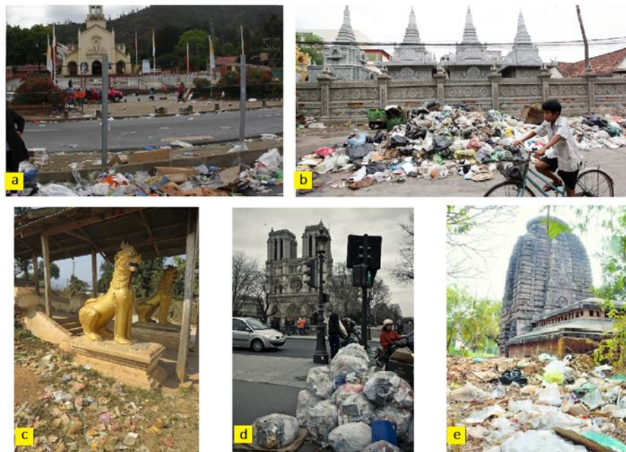
Figura 1. Contaminación del ambiente producto directo de prácticas religiosas

no ha llamado el interés entre los estudiosos, sólo existe interés mediático como el que se describe en la figura 1.