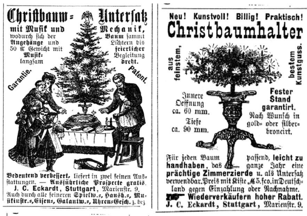
Figura 6. Cosecha de abetos Douglas de rodales naturales durante la década de 1940 cerca de Shelton, WA.