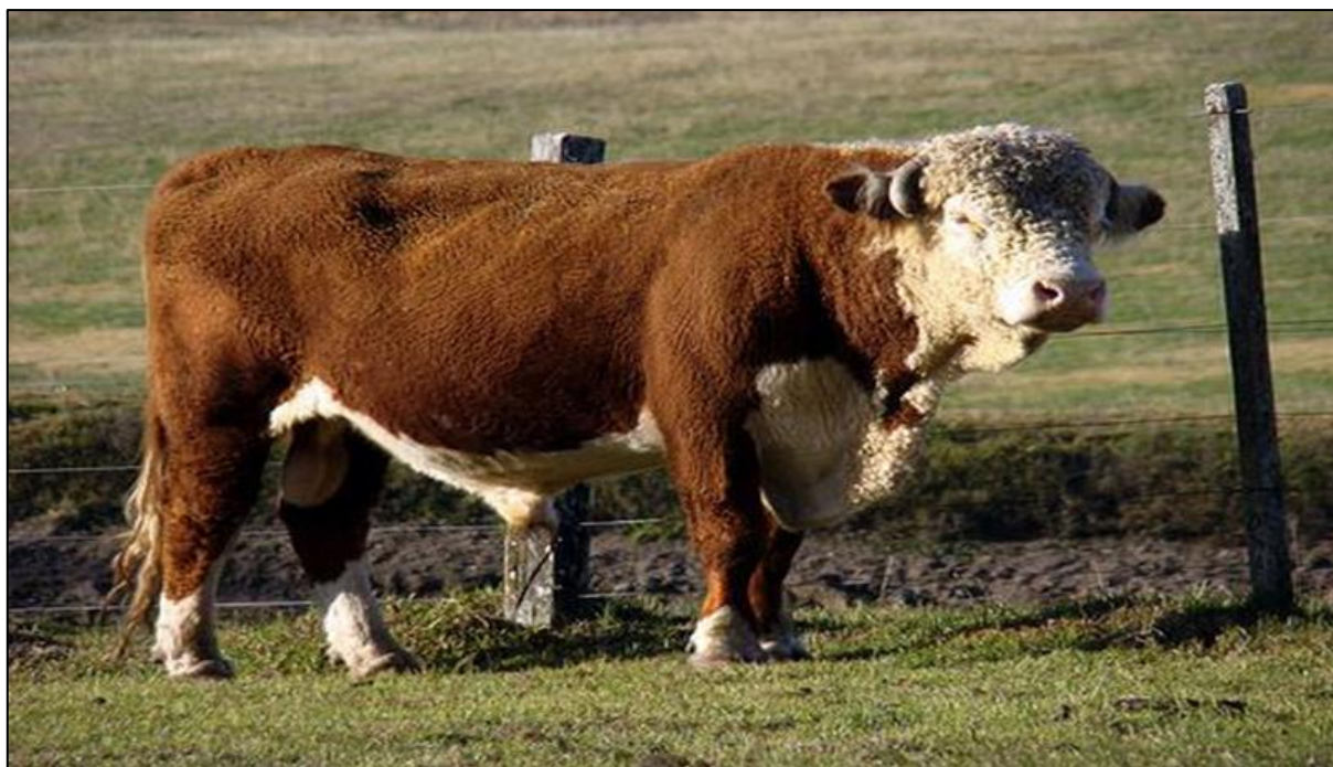
Figura 04. Exemplar de Touro Hereford.