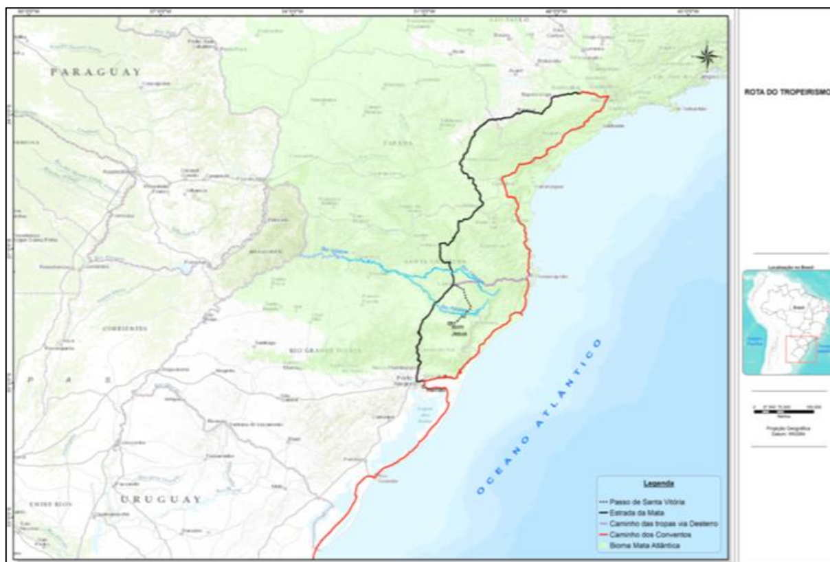
Figura 02. Estradas e caminhos no Planalto Catarinense.

contexto da concessão de sesmarias, um sistema de apropriação do solo que consistia na distribuição de grandes extensões de terras com a justificativa da expansão da agricultura e aplicação de recursos particulares, fomentando a produção com mão de obra familiar, escrava e também servil (Peluso Jr, 1991 p. 32).