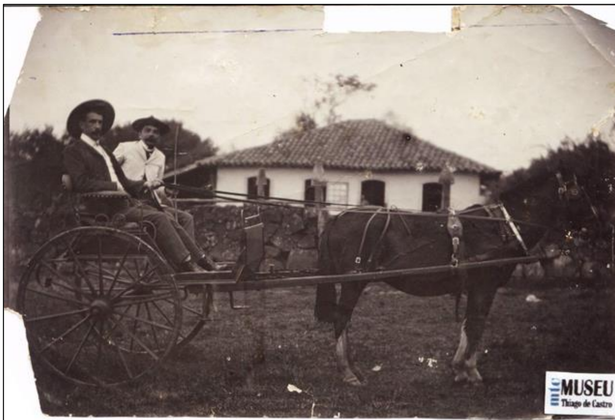
Figura 03. Fazenda Cruz de Malta – Lages.