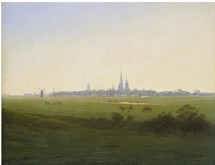
Figura 5. Wiesen bei Greifswald, entre 1820 a 1822, óleo sobre tela.

Fonte: Maria Tsaneva, Caspar David Friedrich: 111 Paintings and Drawings. Ed. Lulu.com, 2014.