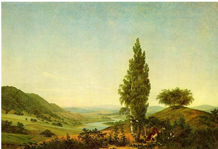
Figura 4. Der Sommer, 1807, óleo sobre tela;