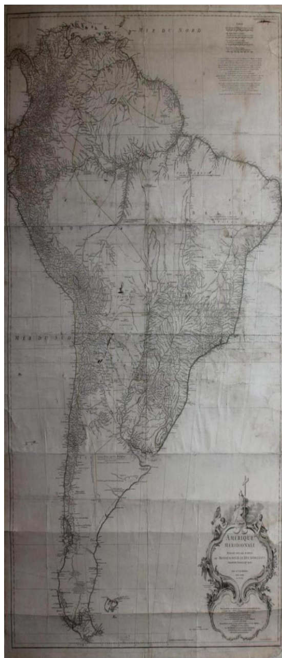
Figura 1. Jean Baptiste de Bourguignon D’Anville. Amérique Méridionale - publié sous les auspices de monseigneur le duc d’Orleans premier prince du sang par le Segneur de D’Anville. MDCCXVIII Avec privilège.