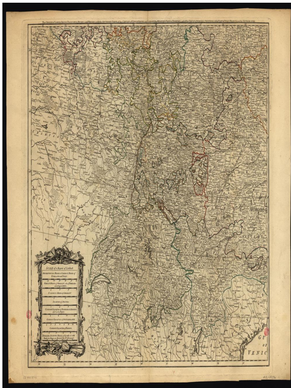
Figura 2. Thomas Kitchin [Material Cartográfico]. The Circles of Lower Rhine, Franconia, Swabia, and Bavaria, with the Southern Parts, of the Circles of Upper Rhine and Saxony, The Western Parts of Bohemia and of the Circle of Austria, Switzerland and Parto of Italy, France and the Netherlands, 1790.