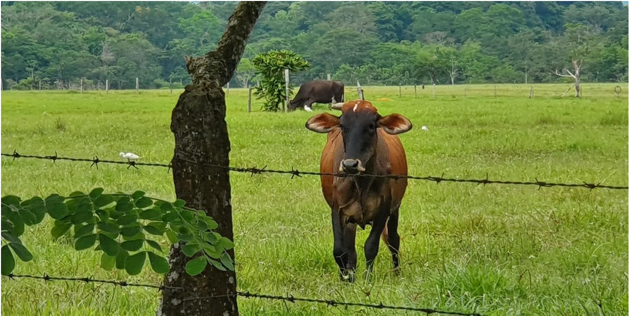
Imagen 3. Ganado pastando en potrero.

es la fuente de energía utilizada para descuajar, desmembrar y desnaturalizar la selva por medio del hacha, el machete y el fuego.