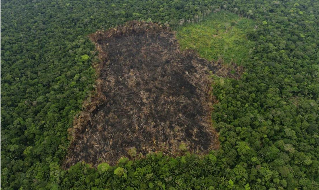
Imagen 2. Huella deforestación selvas amazónicas caqueteñas.

aproximadamente, áreas que dejan de ser ecosistemas biodiversos para convertirse en un paisaje homogeneizado, apropiado y privatizado por medio de la imposición del pastizal sobre la organización ecosistémica 48 amazónica, por la tala y la quema, por la delimitación hecha de la propiedad ganadera privada a través del uso de alambre de púa para demarcar sus límites, sus linderos.