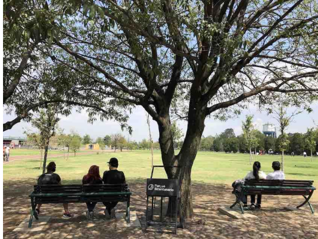
Imagen 1. Vista actual del Parque Bicentenario. Al fondo a la derecha, se aprecia la torre de agua.

También se comentaba que “[...] el Premio Nobel de Literatura, Octavio Paz, ... confió en ‘que pronto podamos respirar y redescubrir el Valle de México.’” 27